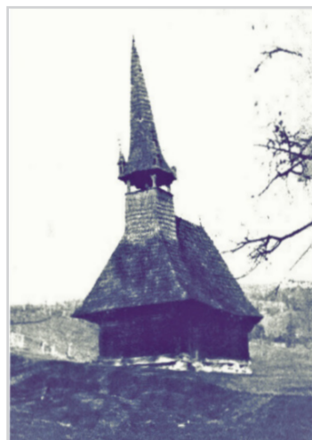
Foto 2. Biserica de la Leurda înainte de intrarea în patrimoniul muzeal, apud Ioana Cristache-Panait

Odată intrată în patrimoniul muzeal, lăcașul va suferi un amplu proces de restaurare. Aproape trei decenii mai târziu, în 6 mai 2024, în cea de a doua zi a Sărbătorilor Pascale, lăcașul va fi resfințit de Înaltpreasfințitul Mitropolit Andrei, alături de un sobor de clerici și mireni.