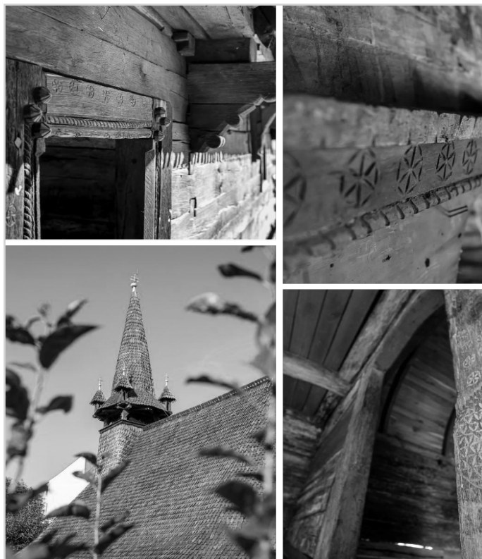
Foto 5. Detalii.

Lor li se alătură un decor sculptat în relief, cu motive de tip zig-zag și dinte de lup, care conferă întregului cadru o vibrație aparte, menită să pună în valoare măiestria meșterilor. În ansamblu, aceste simboluri definesc o ordine sacră a lumii, în care fiecare linie are o funcție protectoare și un sens moral.