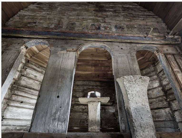
Foto 4. Catapeteasma și altarul Bisericii din Leurda.

Sursa: România atractivă: https://romania-atractiva.ro/ro/profiles/biserica-de-lemn-sfintii-apostoli-petru-si-pavel-leurda