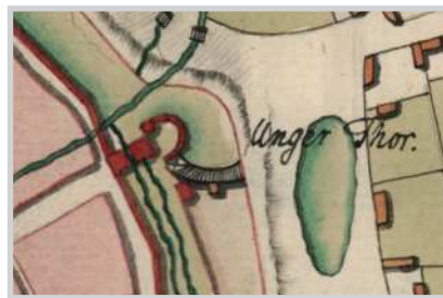
Fig. 7. Planul Porții Ungurilor, detaliu din planul Theumern, 1750