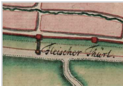
Fig. 2. Planul Porții Măcelarilor de pe latura de nord, detaliu din planul Theuernern, 1750 (Österreichisches Staatsarchiv Viena, Kriegsarchiv)