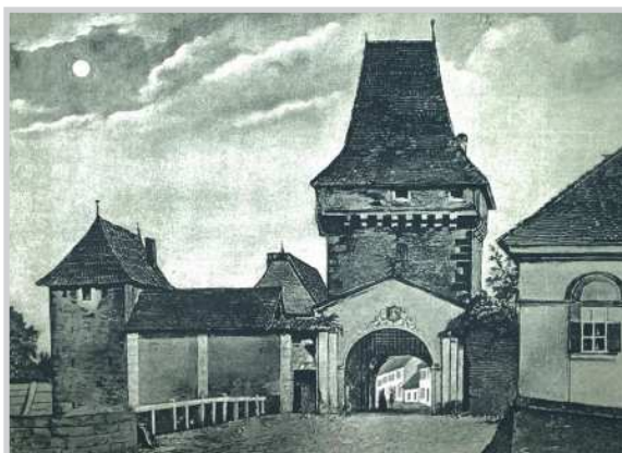
Fig. 4. Vedere cu Poarta Lemnelor înaintea demolării din 1863 (după Sigerus 1904)

( ex steynbruch ) și 26 de transporturi de nisip pentru mortar. 5 Următoarele înregistrări care ne-au parvenit datează din anii 1486 și 1487 când s-a lucrat la zidirea și acoperirea turnului de la Poarta Hospitalului ( turris penes hospitalensem ), 6 la construcția unui nou lupanar, 7 la clădirea Primăriei, la turnul din cetate ( ratione turris in castro civitatis ), situat pe colțul de nord-est al incintei, și la șanțul cu apă; apoi, în vara anului 1488, se plăteau transporturi de piatră pentru construcția turnului de la Poarta Ungurilor/Ungertor și se aducea lemn pentru construcția podului respectiv. 8 Printre meșterii atestați în această perioadă s-au numărat: un maestru pietrar ( Petrus lapicida sau cementarius ), trei dulgheri (maistrul Johannes carpentarius și meșterii Erasmus și Thomas), doi cărămidari (Leonhard și Servacius laterator ) și doi tâmplari (Georgius și Martinus mensator ), care au pregătit matrițe din lemn pentru confecționarea cărămizilor destinate clădirii Primăriei. 9 În 1492 a continuat lucrul la șanțul de apărare și a fost construit acoperișul turnului de la Poarta Lemnelor și cel al zidului fortificației din vecinătatea hospitalului, pentru care s-au cumpărat 2.300 de olane (Fig. 4). În deceniul următor a continuat lucrul la zidirea curtinelor, pentru care în 1503 s-au adus 17 butoaie cu var ( doleis calcis ) de la Turda și Moldovenești/Burgdorf/Várfalva ( Warfalw ) 10 și