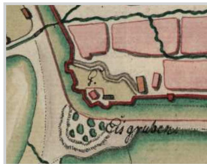
Fig. 8. Planul colțului de nord-est al incintei cu Turnul Croitorilor, detaliu din planul Theuern, 1750