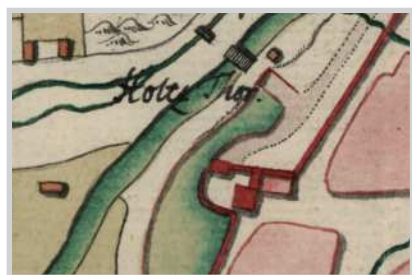
Fig. 6. Planul Porții Lemnelor, detaliu din planul Theumern, 1750