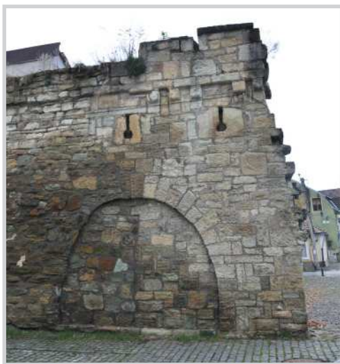
Fig. 10. Fragment păstrat din zidul de apărare cu vestigiile porții secundare de sud