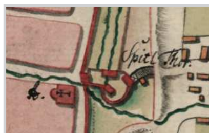
Fig. 5. Planul Porții Hospitalului, detaliu din planul Theumern, 1750 (Österreichisches Staatsarchiv Viena, Kriegsarchiv)

Izvoarele atestă existența unei a treia porți