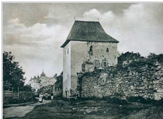
Fig. 11. Vedere cu Turnul Dogarilor și curtea adiacentă înainte de restaurare (după Sigerus 1904)

Turnul Dogarilor, din vecinătatea fostului claustru dominican, împreună cu un fragment din curtea învecinată (Fig. 11).