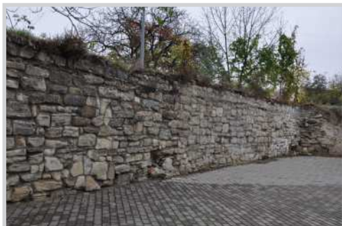
Fig. 9. Vestigii din curțina fortificației de pe latura de est

Basthya ex lapidibus pentru care, la începutul anului 1522, regele Ludovic al II-lea acorda bistrițenilor un sprijin financiar în valoare de 150 de florini din censul Sf. Martin. 66 Ansamblul fortificației a dăinuit până la mijlocul secolului al XIX-lea când zidurile și turnurile, devenite perimate, au început să fie pe rând demolate, iar materialele de construcție rezultate să fie vândute sau refolosite pentru alte scopuri de către oraș. 67 Acțiunea se înscria în amplul curent novator, care în perioada respectivă a marcat evoluția orașelor medievale din Transilvania și din întreaga Europă și care urmărea încorporarea vechilor suburbiilor în intravilan și adaptarea cadrului urban la cerințele funcționale și estetice specifice orașului modern (aparitia unor noi tipuri de activități economice, a dotărilor culturale și de agrement, fluentizarea circulației etc.). Din ansamblul fortificației medievale se mai pot astăzi vedea fragmente din zidul estic, în spațele fostei biserici franciscane (Fig. 9) și din cel sudic, pe actuala stradă Ecaterina Teodoroiu (Fig. 10), în vreme ce dintre turnurile de apărare se conservă doar